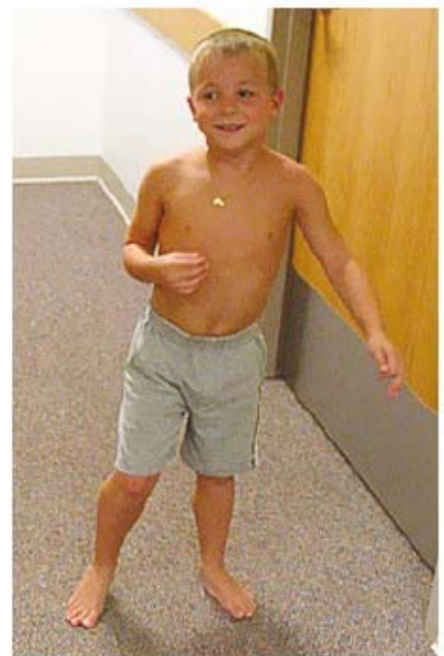
Figure 2. Gowers' Manoeuvre.